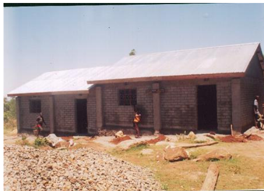
Stand van zaken op 31 oktober 2007.

In de 2 e helft van september kon er gestart worden met de bouw van de kleuterklassen, waarvoor we in 2006 al € 4.000,- hadden ontvangen van de serviceclub Kiwanis Noviomagus. Dat er voortvarend gewerkt is, bleek al toen we medio oktober een eerste verantwoording en foto's van de bouw ontvingen. Met een aanvullend bedrag is de ruwbouw voltooid, zoals op onderstaande foto te zien is. Net op tijd voordat de grote regenperiode aanbrak! Met een laatste bedrag kan de inrichting en de aanschaf van het speel-leermateriaal gerealiseerd worden.